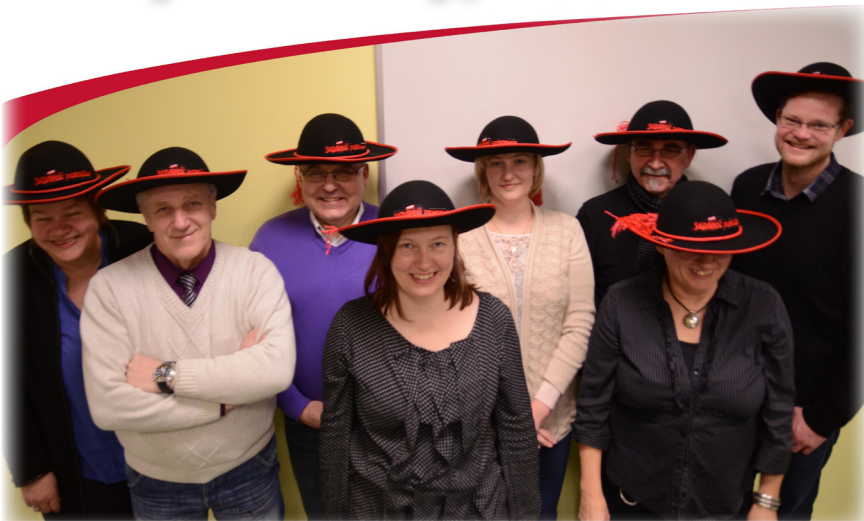
Uczestnicy wizyty studyjnej w Polsce. Spotkanie w Arcyksiężym Browarze w Żywcu, Grupa Żywiec S.A.

W izyta studyjna w Polsce odbyła się w trzech korporacyjnych firmach międzynarodowych: ArcelorMittal Poland S.A. w Krakowie, Grupa Żywiec S.A. Browar w Żywcu General Motors Manufacturing Poland Sp. z o.o. o fabryka Opla w Gliwicach. W trakcie wizyty studyjnej przedstawiciele LO Norway mieli okazję zapoznać się z problemami występującymi podczas negocjacji z pracodawcami w przedsiębiorstwach działających na terenie Polski.